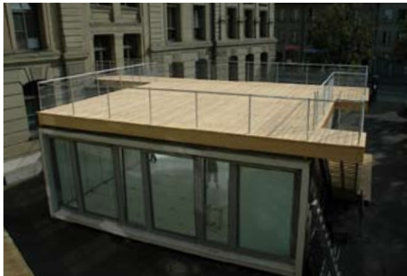
Ausstellung: Zimoun, «Untitled Sound Objects», 2006