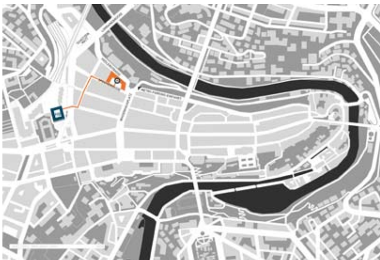
Plan: Büro Destruct

By car: exit the expressway at Bern-Wankdorf, head towards «Zentrum», pass the Bärengraben in direction of «Altstadt», use the Metro Parking in close walking distance.