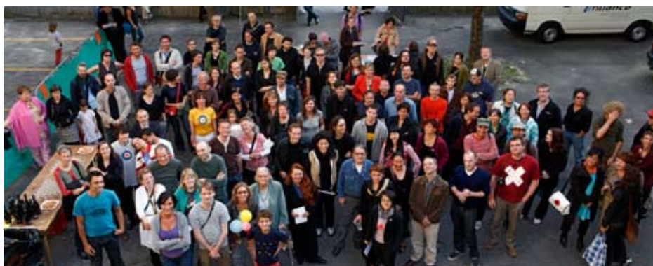
«Klassenfoto» am PROGR_Fest 2007: PROGR_KünstlerInnen und Freunde des PROGR ← Der PROGR, Ansicht Waisenhausplatz