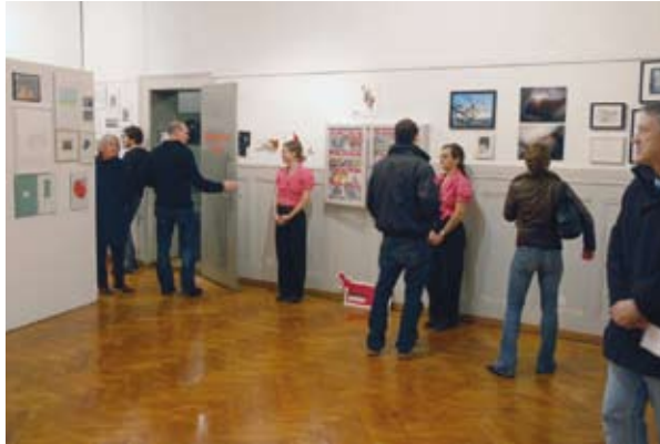
Weihnachtsausstellung 2007 und Präsentation der PROGR_Edition

The PROGR exhibition zone spreads across three former school rooms. The space is used for curated exhibitions featuring resident and external artists. In cooperation with partners like Pro Helvetia, guest projects from various regions such as Eastern Europe, Africa or India can be developed and presented here.